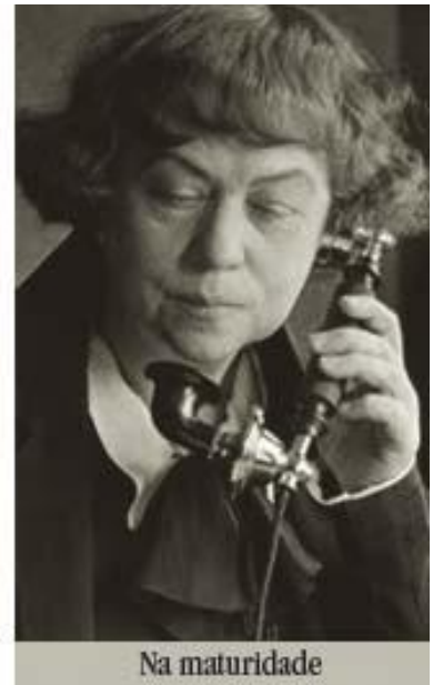
Aleksandra Kollontai noin 16 vuotiaana, noin 30 vuotiaana ja kypsässä iässä