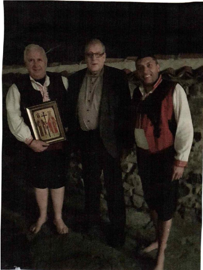
Kirjoittaja tanssijoiden keskellä

Strandzhan alueelta perinne on levinnyt turistinähtävyydeksi kaikkialle Bulgariaan. Itsekään en ole aitoa showta Strandzhassa nähnyt. Seutu on vaikeakulkuisten yhteyksien takana, joskin nykyisin sinne lienee järjestetty turistikierroksia Konstantinin ja Elenan päiväksi. Muiden vierailijoiden tavoin olen seurannut sitä vain turistikohteessa. Näytöksiä järjestetään Sofian lisäksi muissakin kaupungeissa, etupäässä Mustan Meren rannoilla. Paikka, jossa nestinarstvoa katselin on ravintola Vodenitsata (vesimylly) Sofiassa Vitosha-vuoren rinteessä noin puoli kilometria kaupunkia korkeammalla eli 1000 metrin korkeuskäyrän tuntumassa. Näytös järjestettiin ruokailun lomassa ravintolan sisäpihalla. Tanssin jälkeen pääsin kuvaan tanssijoiden keskelle. Hiillos oli silloin jo sammunut, mutta hehkuvat hiilet saatiin kuvattua ennen tanssin alkua. Pimeys häytti tanssijoiden kuvaamista.