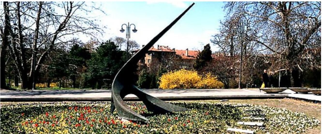
Meripuiston sisäänkäynnillä pylväsrivistön jälkeen on aurinkokello, tyylielty lentävä joutsen.

Sosialismin aikana Revival-käytävän korkeimpaan osaan rakennettiin Pantheon-niminen puolue-muistomerkki ja Kadonneiden antifasistien käytävä. Varnassa vierailleiden venäläisten astronauttien havupuiden istutusperinne on ainutlaatuinen. Vielä tänäkin päivänä Pantheonin lähellä kasvaa maailman ensimmäisen kosmonautin Juri Gagarinin, bulgariaisten kosmonauttien Georgi Ivanovin ja Aleksanteri Aleksandrovin ja monien muiden istuttamia puita.