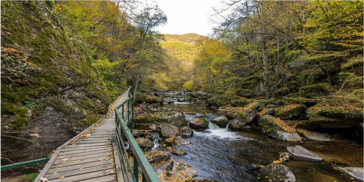
Ekopolkua joen varrella

Strandja-vuoret (Strandzha) sijaitsevat Kaakkois-Bulgariassa ja jatkuvat Turkin puolelle. Ne käsittävät 10 000 neliökilometrin alueen, jonka korkeus on alle 1000 metriä. Bulgarialaisittain alue on matalahkoa. Vuonna 1995 perustettiin Strandjan kansallispuisto entisen suljetun rajavyöhykkeen tilalle. Alue on pitkään ollut koskematon, ja sen kasvisto ja eläimistö ovat saaneet olla rauhassa, mikä tarjoaa loistavat puitteet ekomatkailulle. Alueella kulkee runsaasti pyöräilyteitä ja vaellusreittejä.