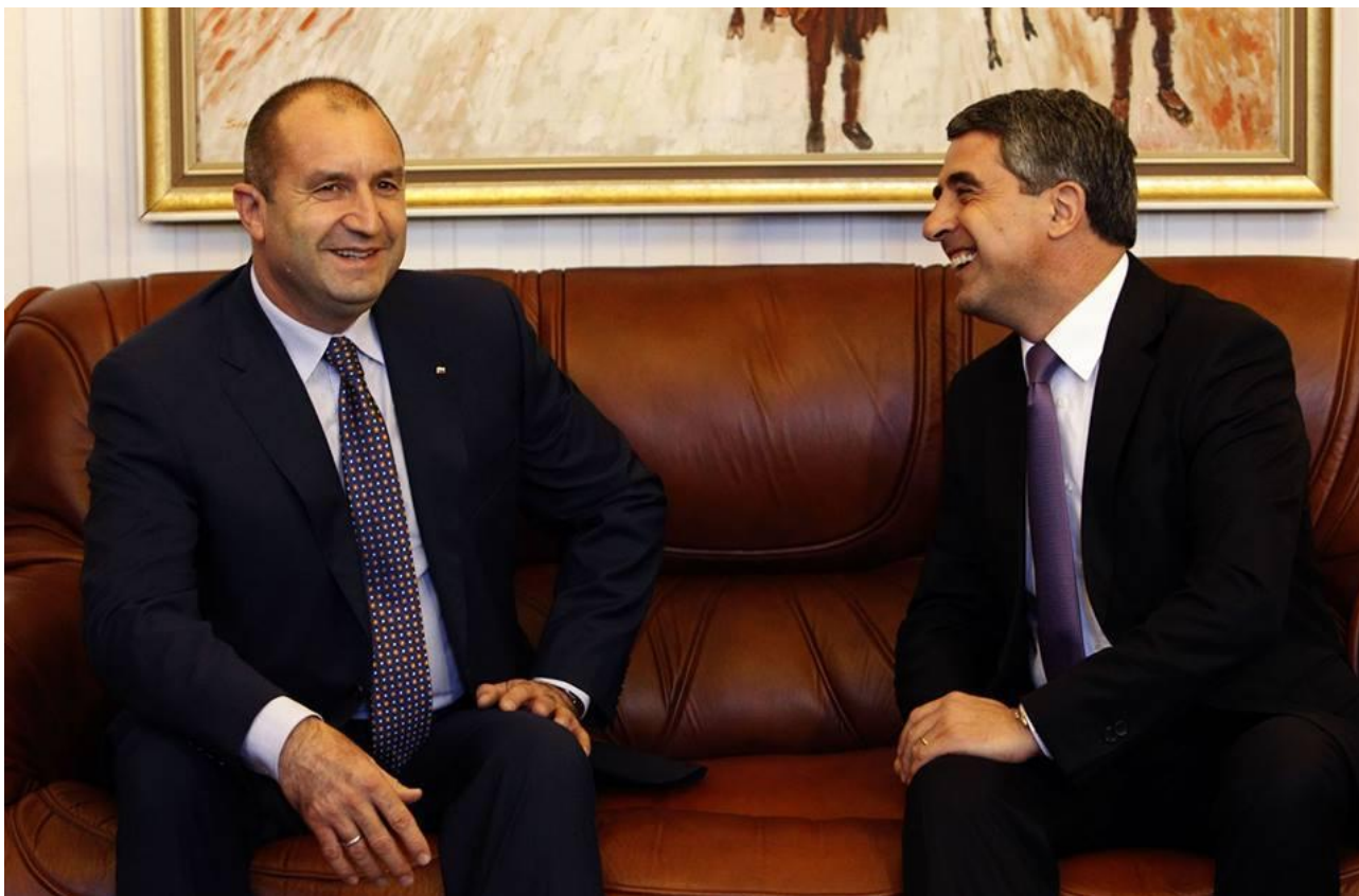
Uusi presidentti Radev ja väistyvä presidentti Plevneliev

Rumen Radev (bulg. Румен Радев) syntynyt 18. kesäkuuta 1963 Dimitrovgradissa ja valittiin presidentiksi 59,4 prosentin ääniosuudella, kun vastaehdokas parlamentin puhemies Tsetska Tsatscheva sai 36,2 prosenttia äänistä.